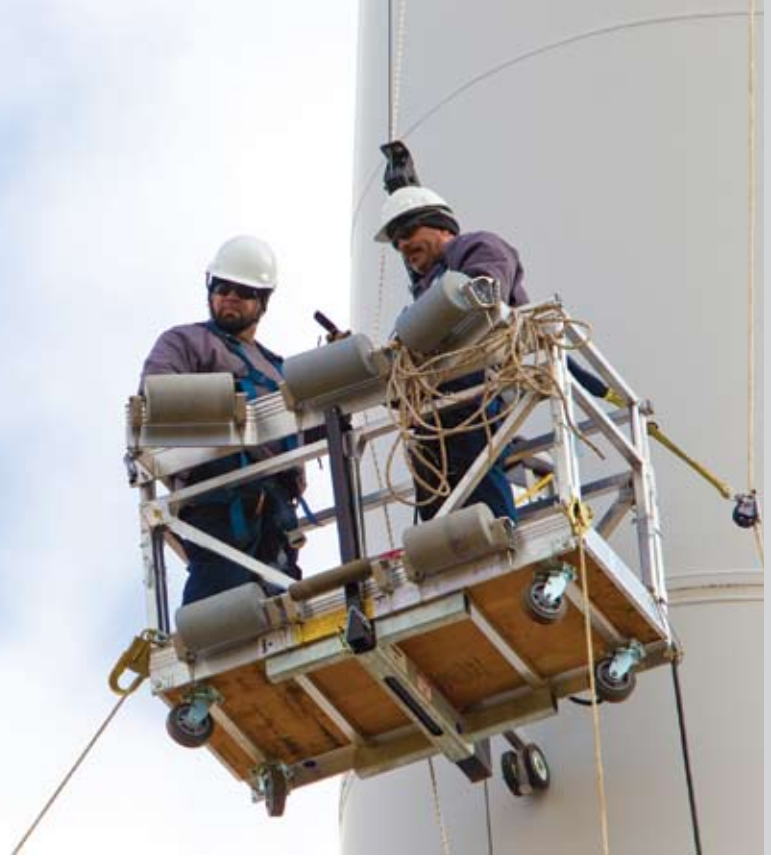
PLATAFORMA DE INSPECCIÓN DE CUCHILLAS

Obtenga acceso a ventas, alquileres, servicios de mano de obra, soluciones de seguridad y capacitación para los profesionales de operación y mantenimiento de Wind